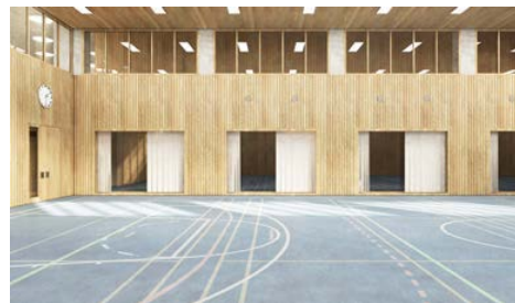
Modell und Visualisierungen des neuen Sekundarstufenzentrums «Burghalde» in Baden

Markstein AG Haselstrasse 16 5401 Baden +41 (0) 56 203 50 00 baden@markstein.ch